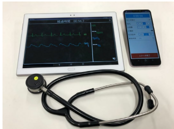
IoT型聴診器とシミュレータシステム

COVID-19の制限下で、分担者の京都大学医学部附属病院内での模擬講習による効果計測実験より試作したNCPR講習シミュレータの機能検証と改善点の抽出を行った。